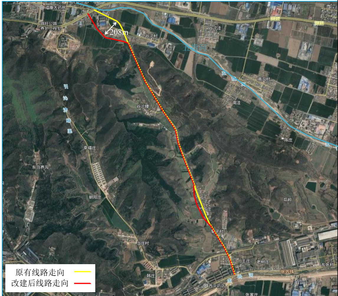
图 2-1 线路走向图

调整最大位移 208m，线路沿线声敏感点无变化（详见选址选线环境合理性分析），线路走线基本与原线路一致，改造后路基宽度 25.5m，采用一级公路技术标准，设计行车速度为 80km/h。改建前后道路技术指标对比见下表，线路走向见下图。