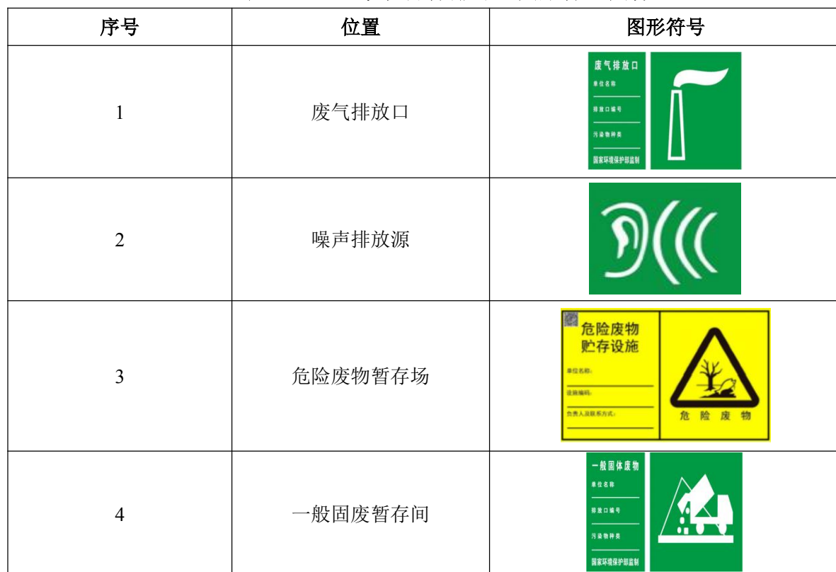
表 4-23 本项目各排污口图形标志图样

排放一般污染物排污口（源），设置提示式标志牌，排放有毒有害等污染物的排污口设置警告式标志牌。本项目各排污口图形标志样图见表 4-23。