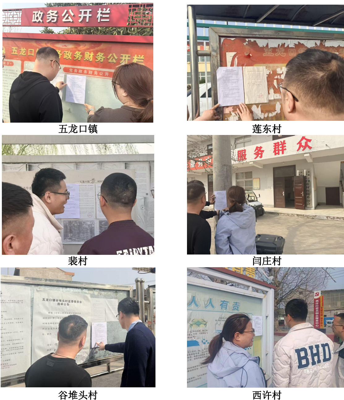
图 7 张贴公告（部分）

我公司于征求意见稿公示期内在项目周围五龙口镇、东许村、莲东村、裴村、谷堆头村、休昌村、闫庄村、西许村等进行了环境影响报告书征求意见稿信息张贴公示。村庄张贴公示现场照片见下图。