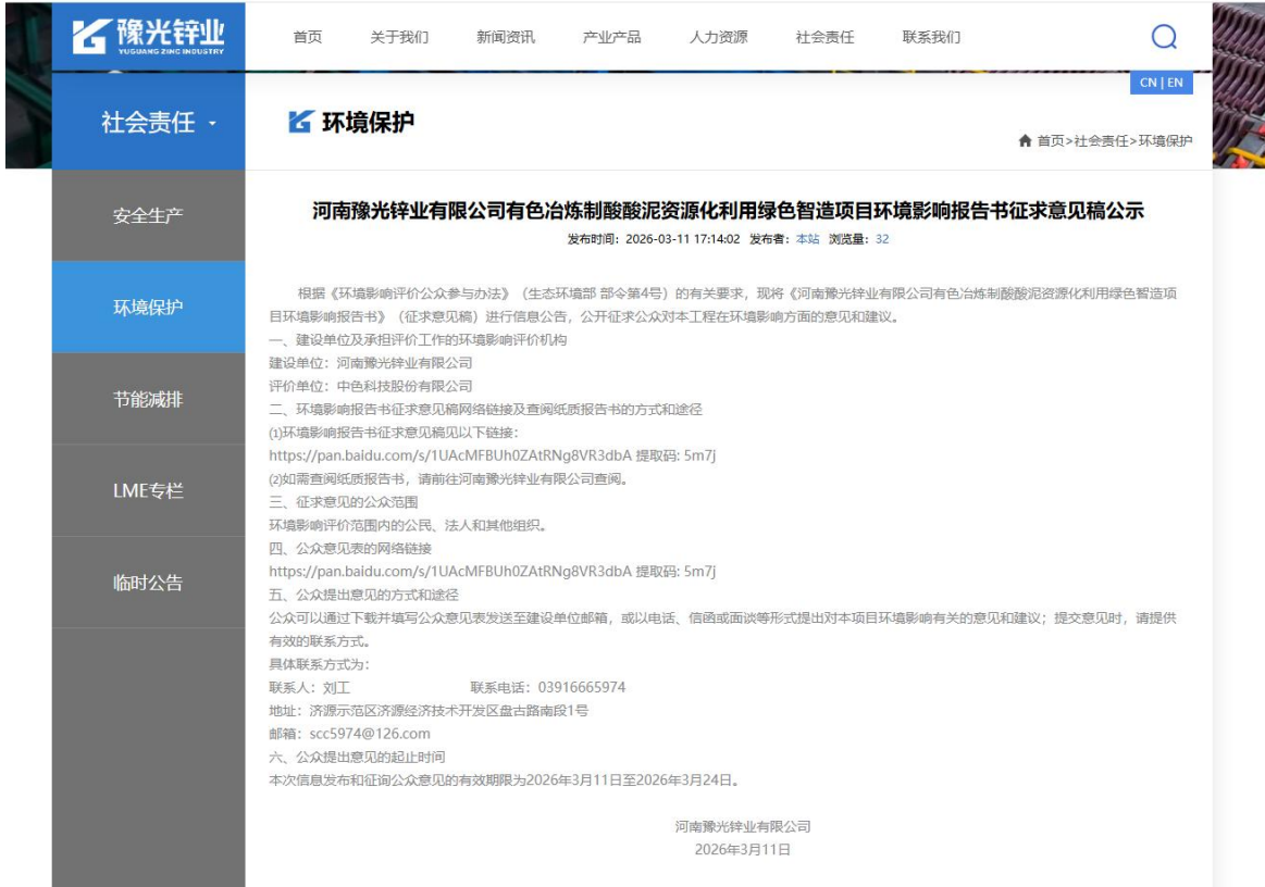
图2 征求意见稿网络公示截图

本项目于2026年3月11日~3月24日，在豫光锌业网站（网址： https://www.ygzn.com.cn/cn/NewsInfo.aspx?Id=11248 ）以网络公示的形式进行了环境影响报告书征求意见稿网络公示。公示截图如下。