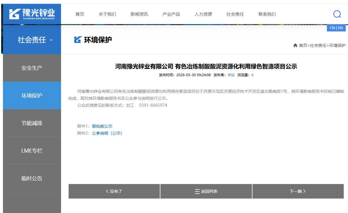
图 8 报批前公示