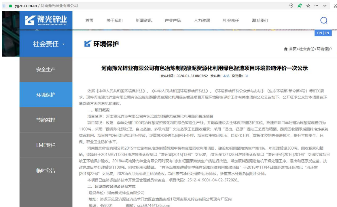
图 1 一次公示截图