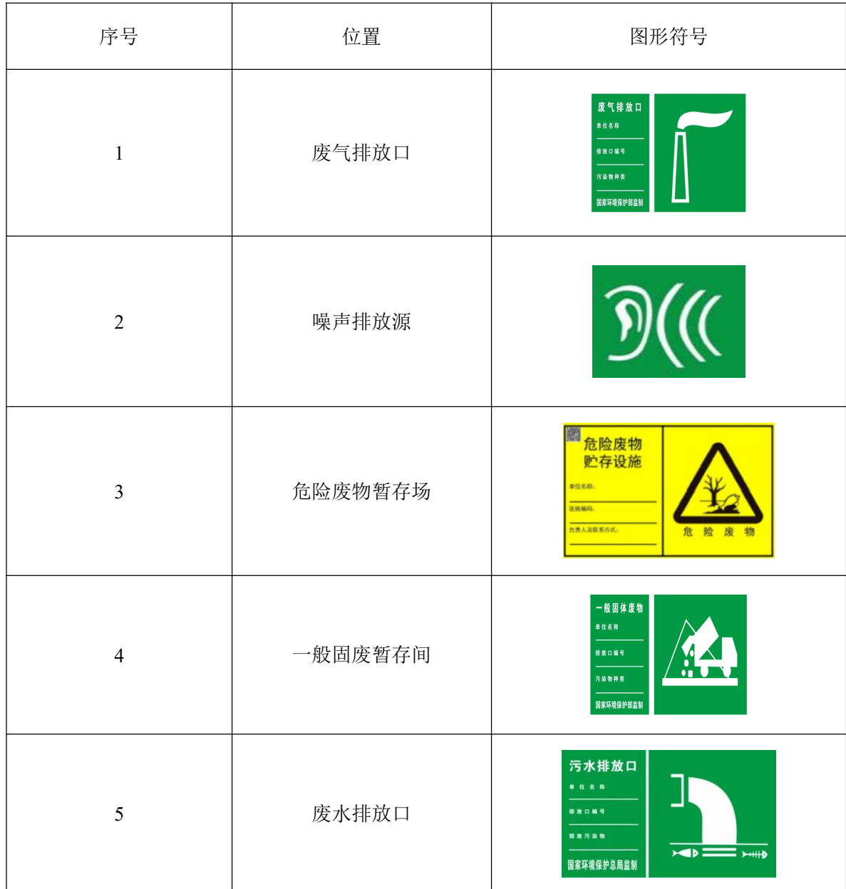
表 4-16 本项目各排污口图形标志图样

标志牌设置位置在排污口（采样点）附近且醒目处，高度为标志牌上缘离地面 2 米。排污口附近 1 米范围内有建筑物的，设平面式标志牌，无建筑物的设立式标志牌。