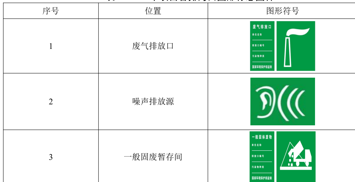
表 4-12 本项目各排污口图形标志图样

排放一般污染物排污口（源），设置提示式标志牌，排放有毒有害等污染物的排污口设置警告式标志牌。本项目各排污口图形标志样图见表 4-12。